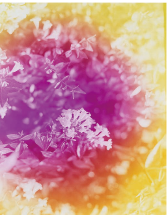
園井義典 シリーズ《私は、あなたがそれに何をみるのかに関心がないのです》より 2019年