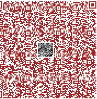
小池裕也 シリーズ《接続と切断》より「QR」 2020年