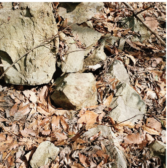
篠田優 シリーズ《有用な建築》より「無題(ズリ)」 2019年